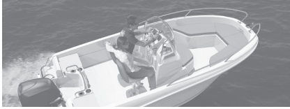
Cap Camarat 4.7 CC